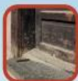
Áreas de tráfico pesado/mucho tráfico o uso