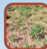
Áreas y jardines exteriores