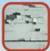
Pintura que se descascara/desprende